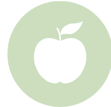
Universitet och högskolor